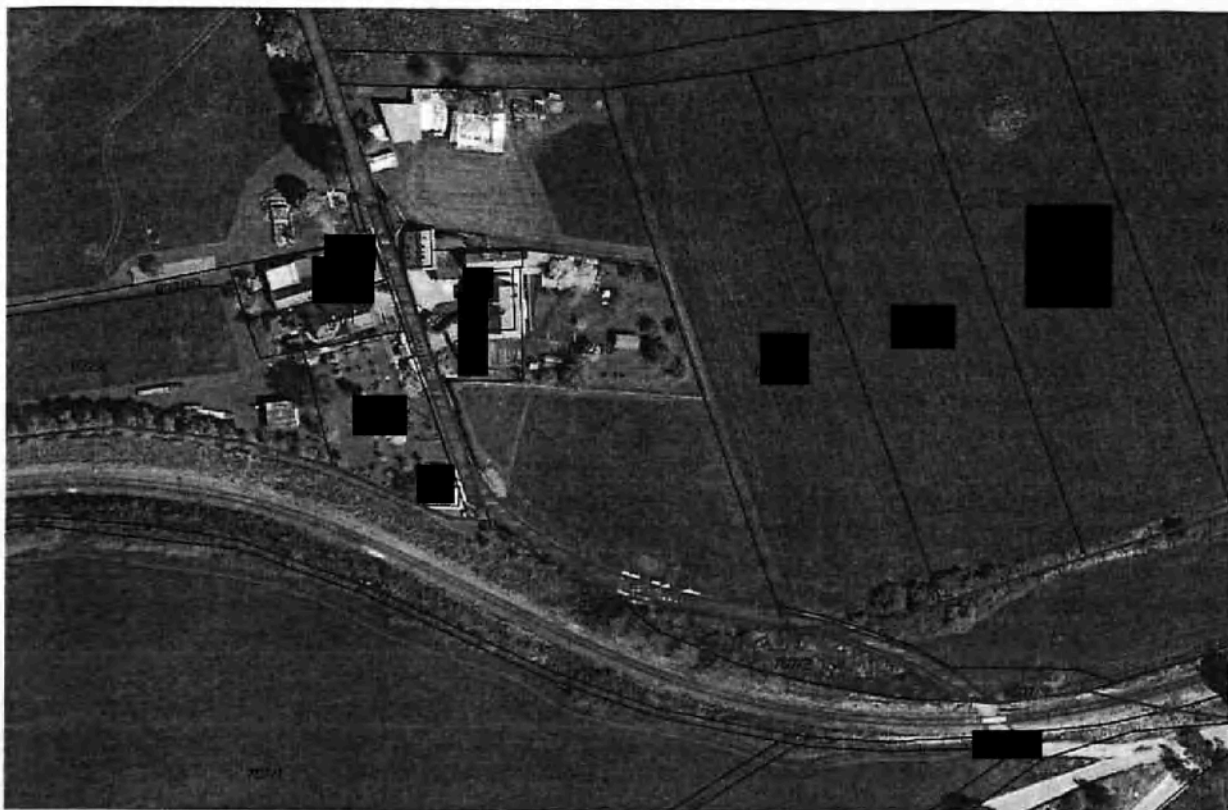
(Obrázek č. 2: červeně je vyznačen průběh komunikace na pozemku [REDAKCE] modře je vyznačen přesah předmětu žádosti i na sousední pozemky a zeleně je vyznačeno pokračování komunikace v nezpevněné podobě.)

prokazující, že komunikace na pozemku [REDAKCE] je v jeho vlastnictví a z průběhu řízení vyplývá, že tuto skutečnost nikdo nezpochybňuje a je realitou, že každý vlastník dotčeného pozemku je tak i vlastníkem stavby komunikace umístěné na něm. Sami žadatelé už v podané žádosti v bodě č. 4 uvádějí, že komunikaci sami na své náklady zpevnili živičným krytem.