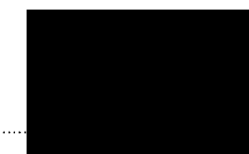
náměstek hejtmanky poskytovatel