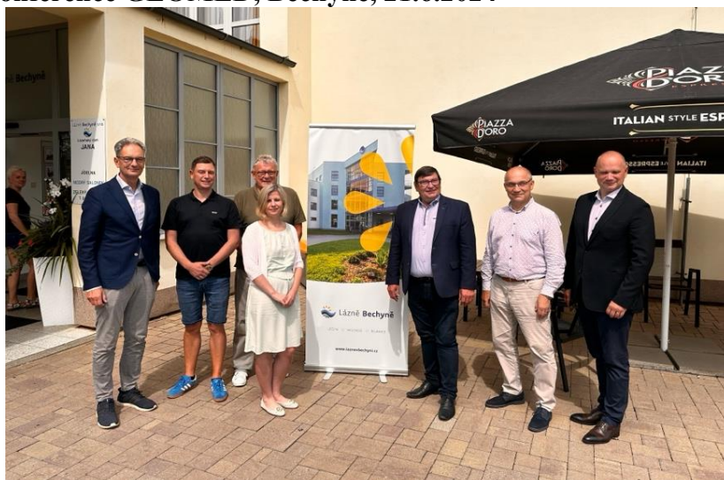
Obrázek 2: Konference GEOMED, Bechyně, 21.6.2024