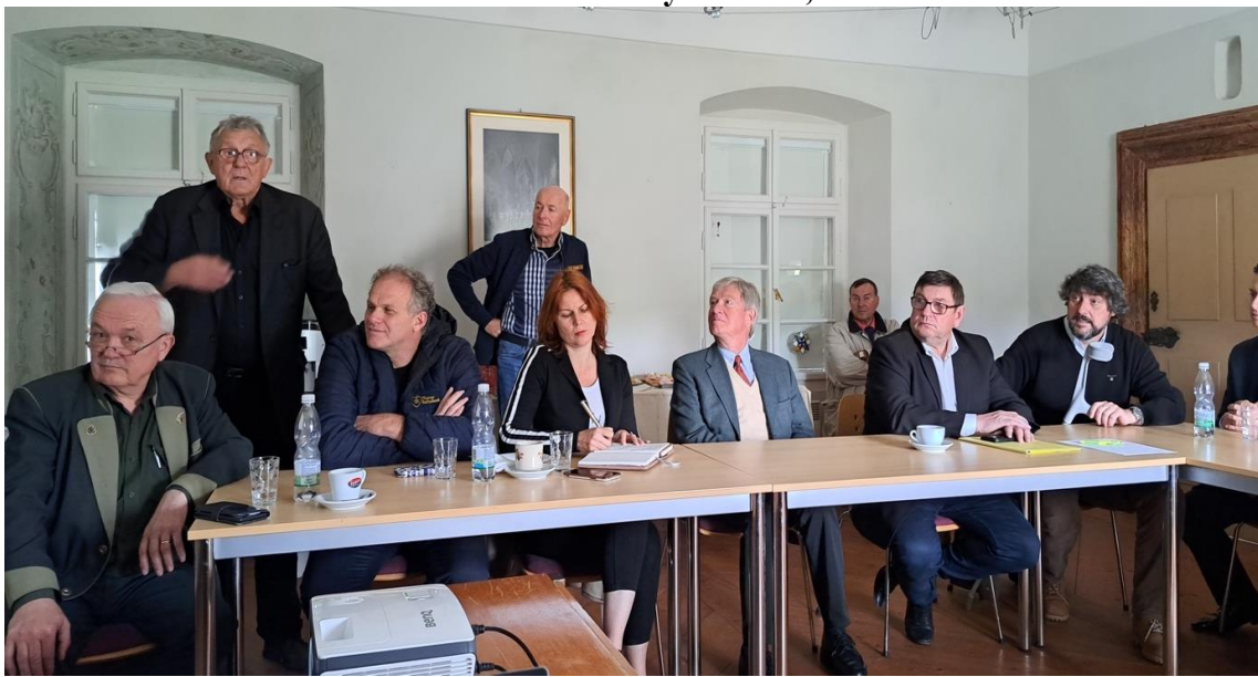
Obrázek 1: Konference GEOMED ve městě Vyšší Brod, 19.4.2024