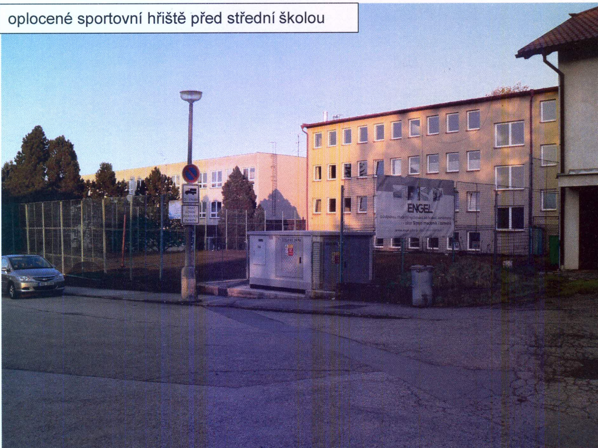
oplocené sportovní hřiště před střední školou

část pozemku parc. č. 1530/2 ve vlastnictví fyzické osoby nacházející se za plotem, určená ke směně (nově oddělená parc. č. 1530/4 o výměře 42 m 2 )